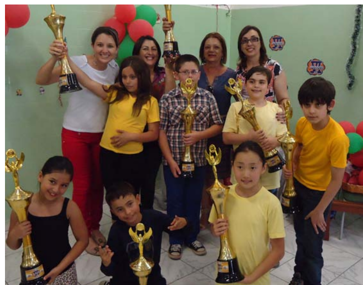
fecha o ano de 2013 com campeã do Estado de São Paulo, a nº 1.