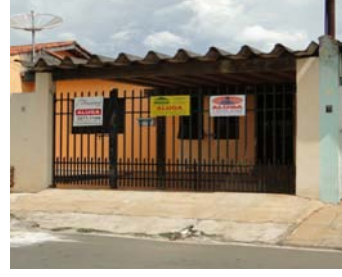
4º- cód- 182, 02 dormitórios, sala, cozinha, banheiro, área de serviço, quintal e garagem. R$- 170.000,00, Jd. Fogaça.