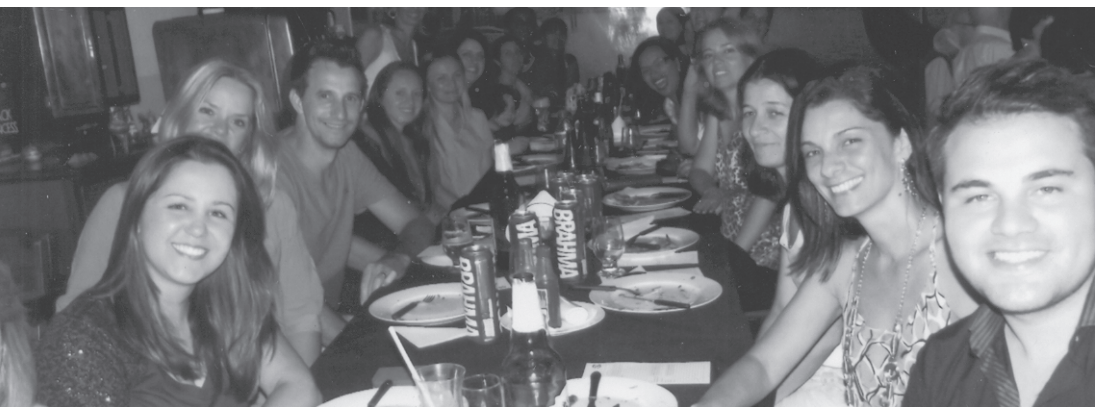
Alunos e professores da EMEF "Nivaldo Lazaro do Carmo", do Bairro Tateté, em Alambari, em meio a alegria e troca de presentes estiveram confraternizados no último dia 17, na Pizzaria Itapê.