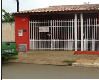
3º- cód- 195, 02 dormitórios, sala, cozinha, banheiro, área de serviço, quintal e garagem, Jd. Viera de Moraes, R$- 200.000,00.