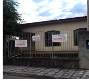
2º- imóvel em Sorocaba, 03 dormitórios, venda ou locação.