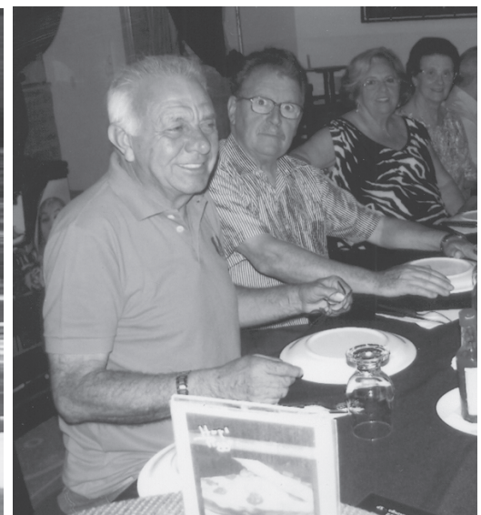
Nas tradicionais confraternizações de Natal e Fim de Ano, mais uma vez os membros da Academia Itapetiningana de Letras estiveram congregados em jantar na última 3ª feira, na Pizzaria Itapê.