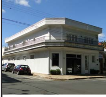
1º- imóvel comercial, com apartamento em cima, ótima localização, informação no escritório,

Desejamos a todos vocês um ótimo Natal e um Ano Novo com muita saúde, prosperidade. Que o ano que vai chegar seja muito melhor do que esse que está indo embora. Um grande abraço a todos. Boas Festas!