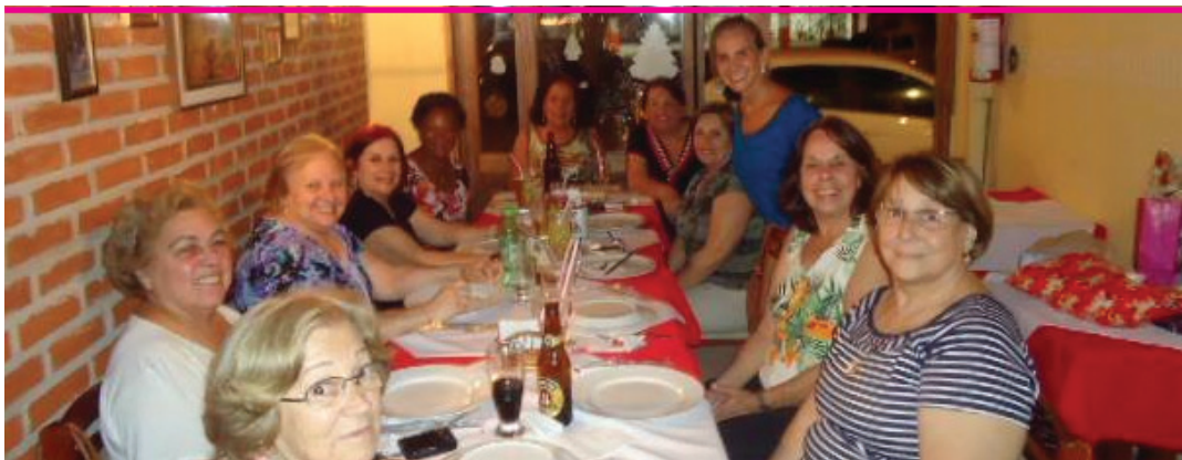
As "meninas da melhor idade" do voleibol de Itapetininga, depois das muitas conquistas obtidas ao longo do ano, se reuniram para merecida confraternização...