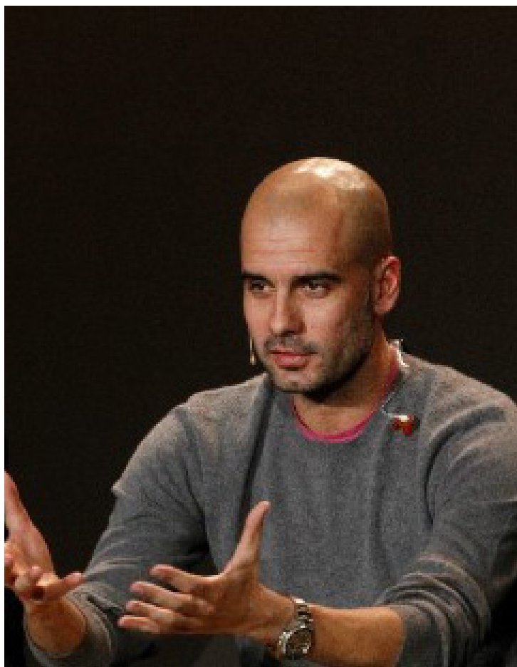
Jupp Heynckes, o Bayern de Munique se comprometeu com um dos técnicos de

maior sucesso e talento do futebol mundial: Pep Guardiola", segue o texto. "O