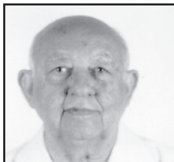
Dr. Bastos AJORI 372

Presos os três malfetores e levada a vítima ao Hospital Miguel Couto desamarrados que foram os seus membros, foi encerrada uma cena só compatível com as figuras de