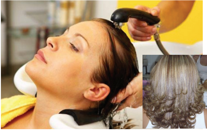
O Cabelo dos seus sonhos...Victoria Hair Company a sua grife da BELEZA...

Rua. Monsenhor Soares, 548 - Centro Tel : 3272-9986