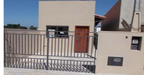
02 Dormitórios, sala, cozinha, wc, lavanderia, quintal, e Garagem... (REF: NC 244)